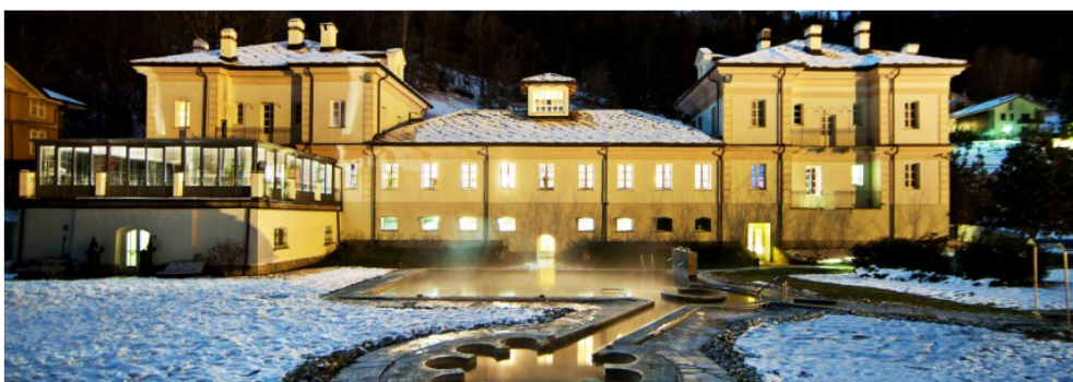
TERME DI PRÉ SAINT DIDIER