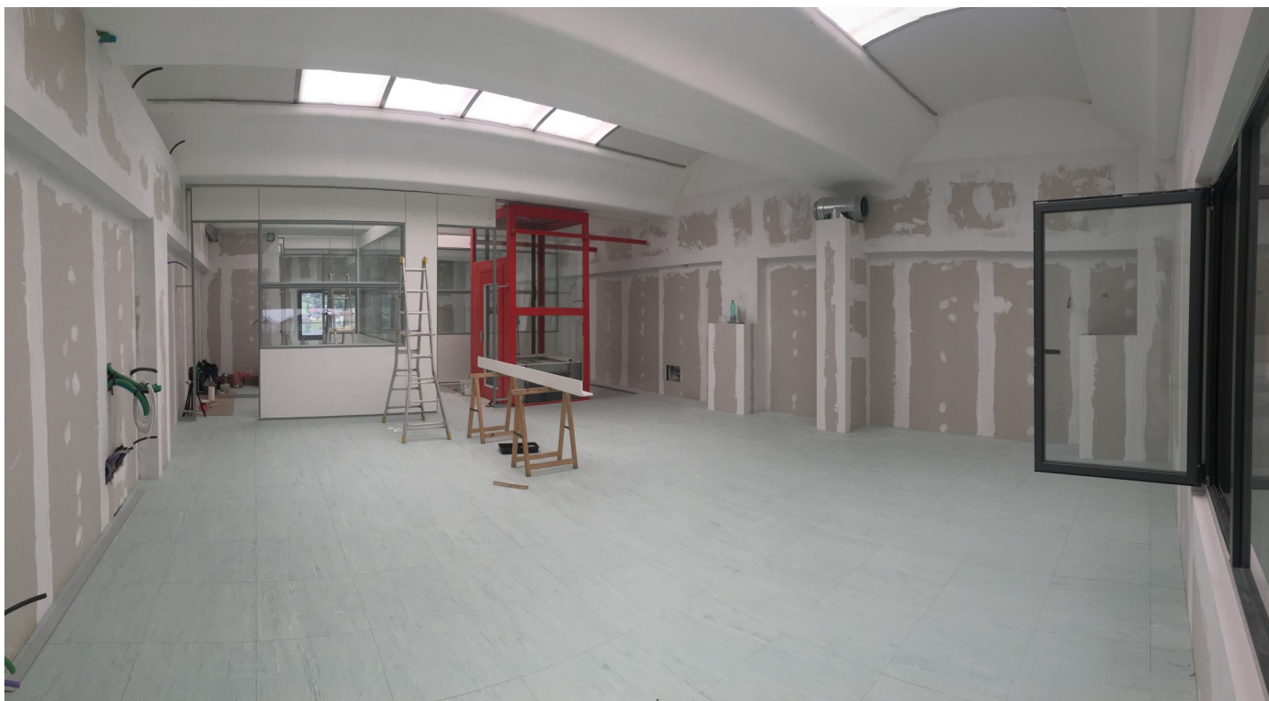
Foto: la sala riunioni e vista di un ufficio amministrativo