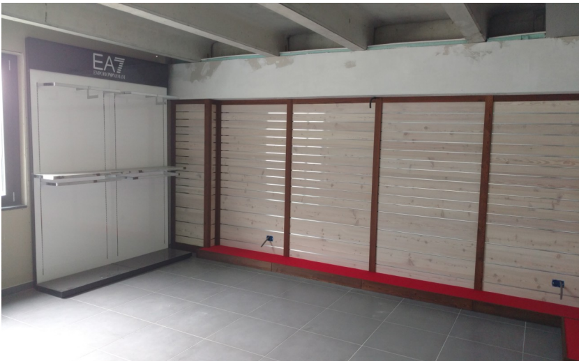
Foto: il pianoterra con lo showroom e l'ascensore interno

Di seguito alcune prime immagini degli Uffici amministrativi e dello showroom che stanno prendendo forma.