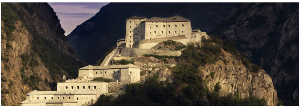
FORTE DI BARD

La Card YELLOW al prezzo speciale, è acquistabile presso la sede dell'Associazione Maestri di Sci.